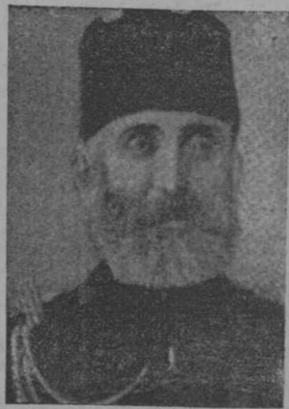
El general Chukri-Pachá, defensor de Andrinópolis.

bates de Kerkilise y de Lule-Burgas toda la serenidad que necesitó para acreditarse de valiente; y no era indiferencia patriótica su deseo de concertar la paz, porque en su larga y brillante carrera militar hubo de merecer encomios que sobradamente justificó.