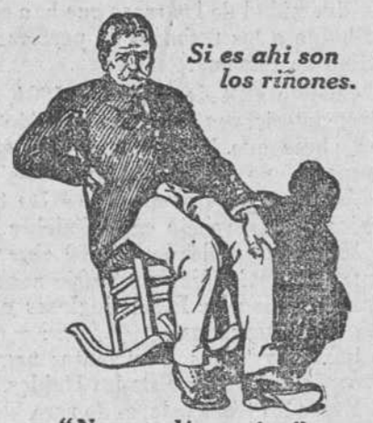
"No me dá respiro."

Un Mal Dorso y Unas Coyunturas reumáticas, quieren decir Miseria Inseparable.