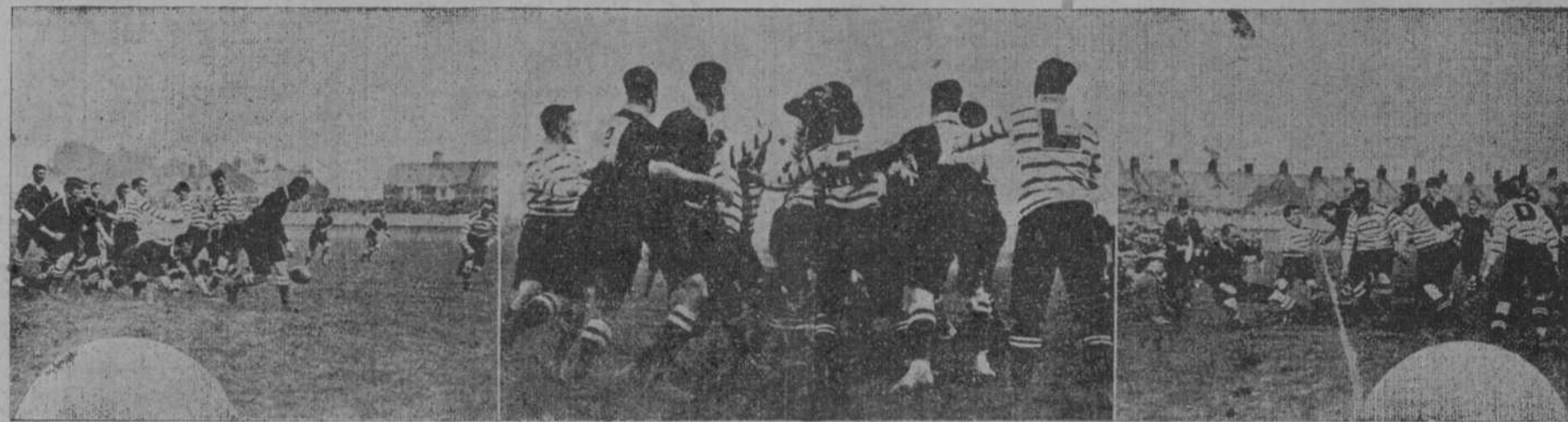
El match Sud-afriano contra Devon.