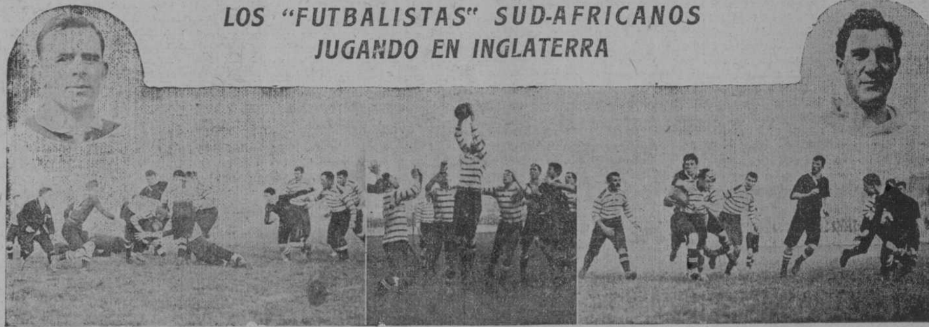
Devon es rechazado por los sud-africanos