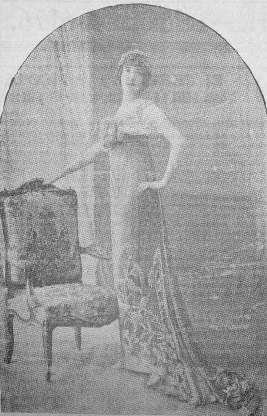
TRAJE DE BAILE, POR LAFERRIERE.