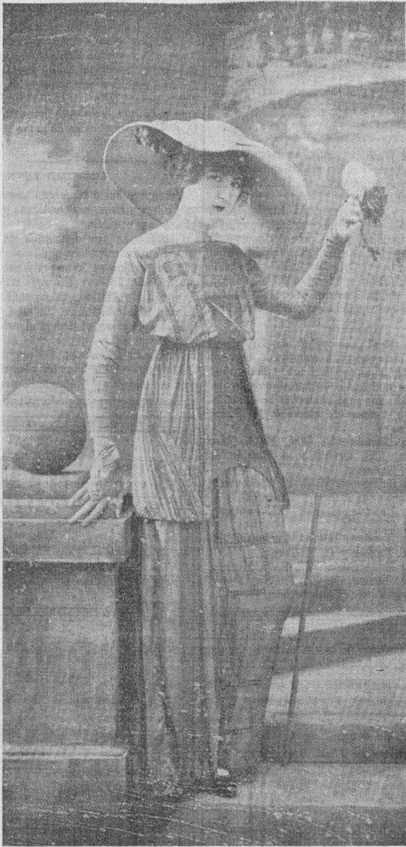
TRAJE DE PASEO, POR MARGAINE-LACROIX.

En cuanto á la belleza, es uno de sus mayores enemigos; sin sueño apacible no hay suavidad en el cutis ni lustre