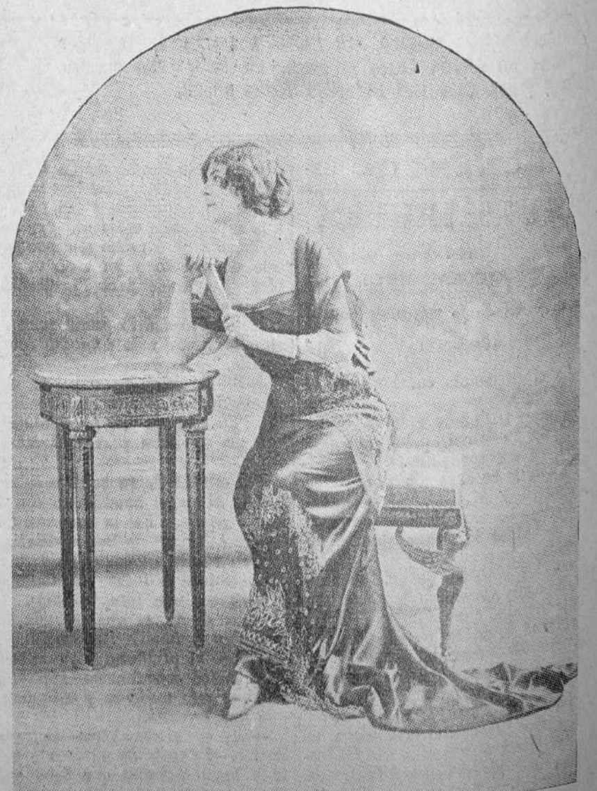
TRAJE PARA TEATRO ó SOIREE, MODELO DE BUZENET.