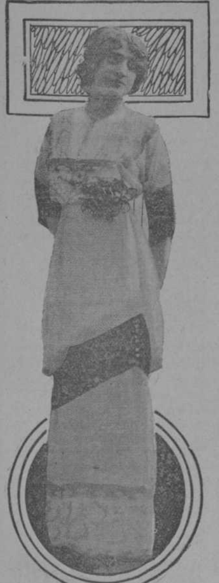
Bonito traje de muselina de seda blanca con pequeñas lentejuelas negras.

La caoba y todas las maderas se oscurecen frotándolas con aceite de linaza caliente.