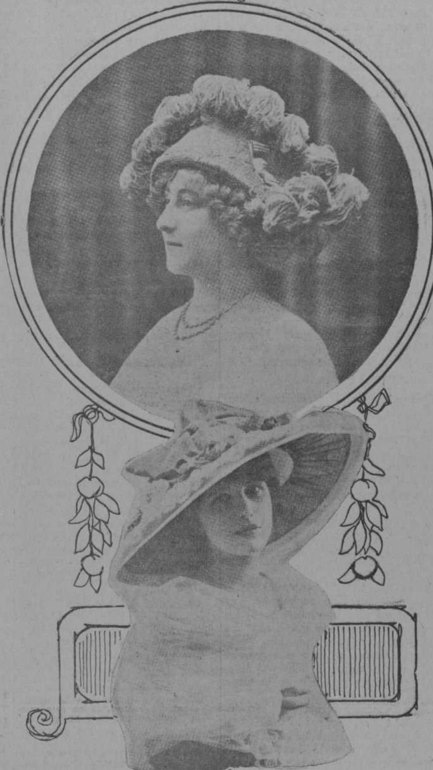
ARRIBA.—Bonito sombrero adornado con cabezas de pluma rizadas. ABAJO.—Sombrero de paja, forrado de seda, con caprichoso lazo al centro.

Debe hablarse en voz baja, pero distinta. Gritar cuando se habla, indica hábitos vulgares, algunas veces, espíritu de dominación. Para conservar un tono de voz conveniente, no hace falta gritar, porque esto endurece la voz. ¡Nunca, nunca debe gritarse, aunque estemos encolerizados! Cuando los pequeñitos chillen rabiñosos, echadle unas gotas de agua en la cara, y dejadlos sin decirles nada: ellos se calmarán, evitando accidentes que pueden poner en peligro su existencia.