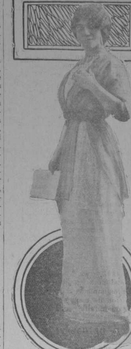
Bonita toilette de exquisito gusto. El traje es de muselina de seda, color violeta.