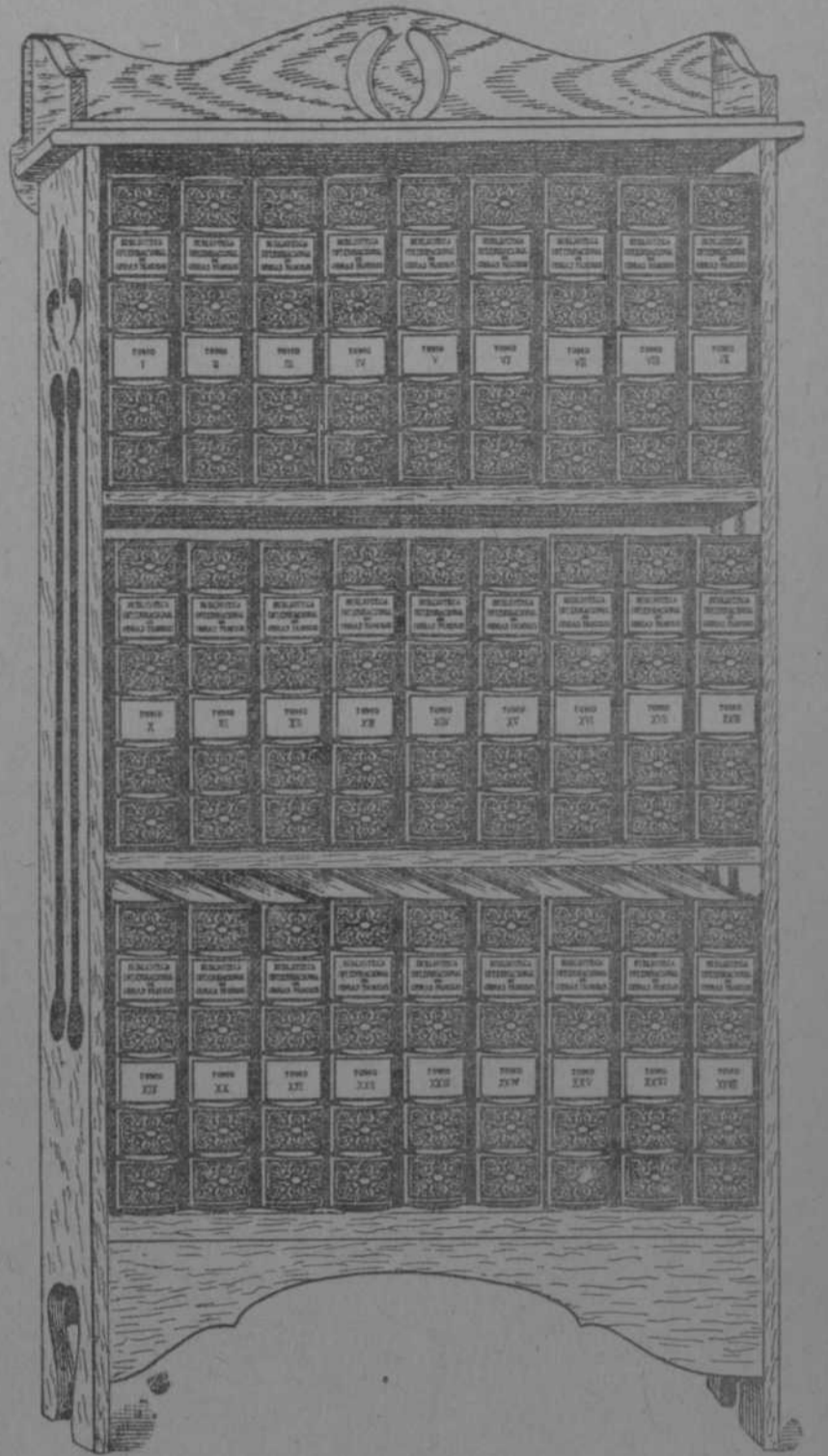
LOS EMINENTES COMPILADORES

Mandaremos el folleto, gratis y franco de porte, al recibo del cupón que va inserto abajo, dando el nombre y dirección del solicitante.