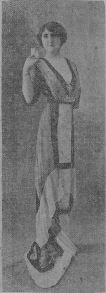
Traje para comida, modelo original de la casa Agnes de París.

Qué hermoso debe ser al llegar a la vejez extrema, poder mirar hacia atrás y ver los largos años del pasado colmados de obras santas y pensar que en la hora suprema de rendir cuentas se oigan las palabras de la Parábola: