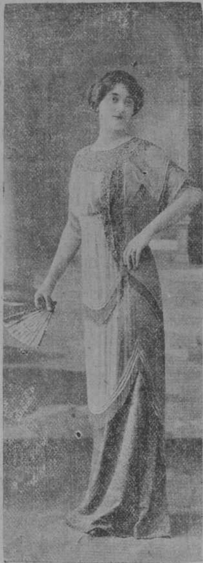
Otro traje para comida, modelo de la casa Zimmermann.

—¡Cuántas cosas lleva encima esa buena señora! ¡Cuánta paja se habrá necesitado para fabricar ese gorro colesal! ¡Cuánta pluma para ese penacho blanco! ¡Qué mangas tan largas y faldas tan anchas! ¡Cuánta cinta y cuánta