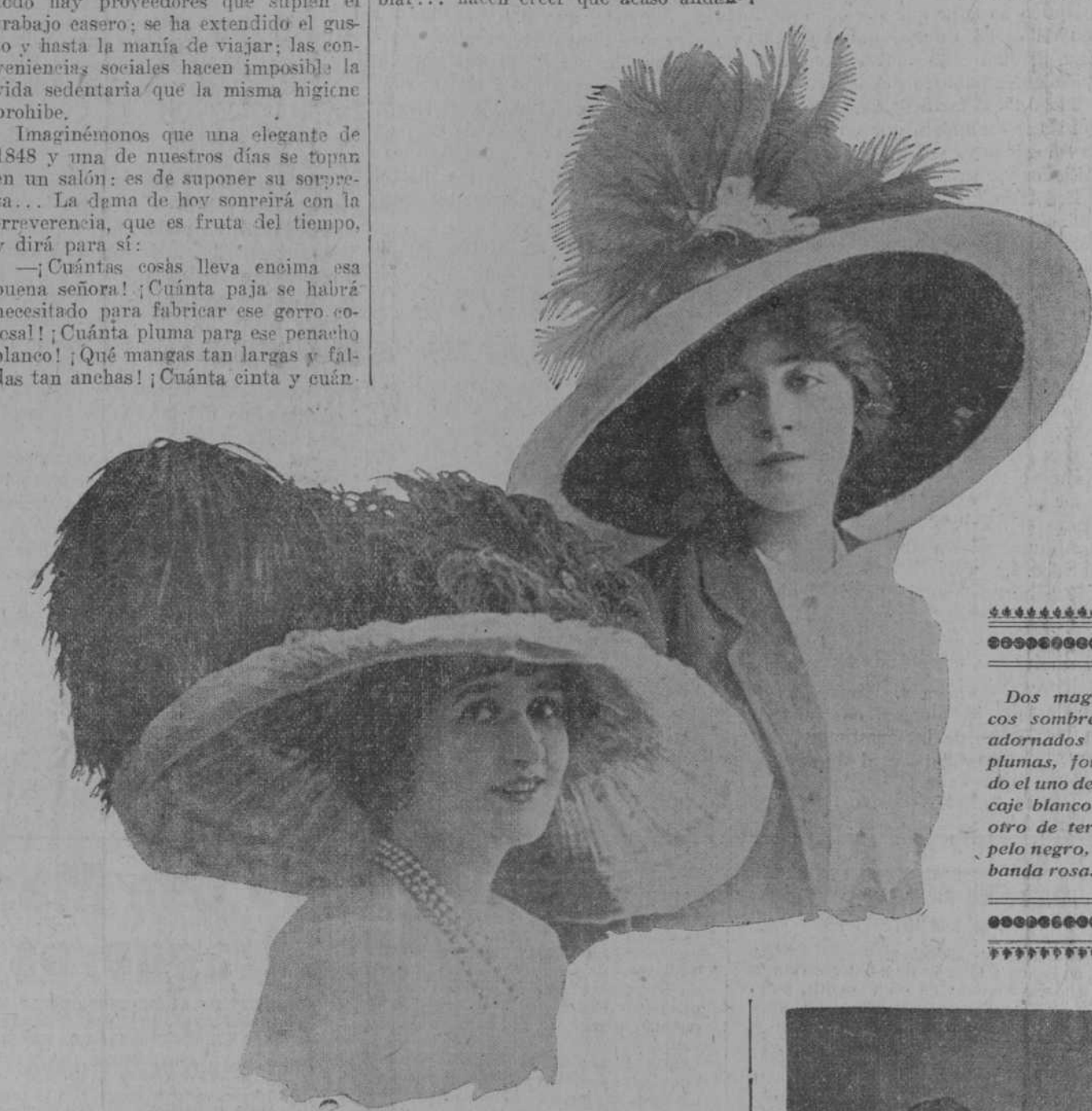
Los magníficos sombreros adornados con plumas, forrado el uno de encaje blanco y el otro de terciopelo negro, con banda rosa.