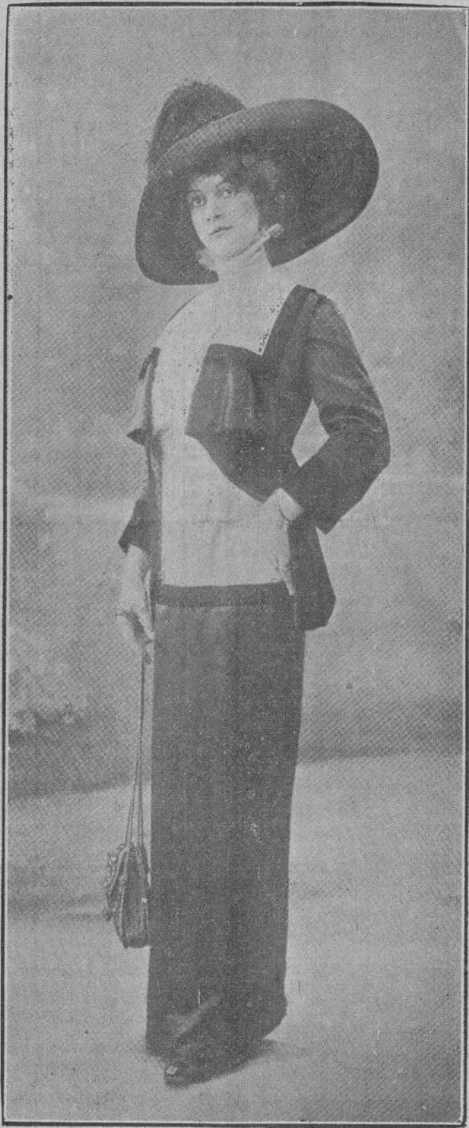
Bonito modelo de traje para calle ó paseo. A su elegancia hay que añadir la comodidad y sencillez.

una gravedad sensual; gracia sin ace- leraciones, reflexiva, en la cual la ex- presión se manifiesta en la intensidad de los gestos, que no en esa vivacidad que trae á la memoria, y hasta la jus- tifica algunas veces, la pretensión de Darwin. Y, sin embargo, no es de esa gracia tan alabada de poetas, y hecha ya tópico vulgar por los cronistas de salones, de lo que voy á divagar aquí.