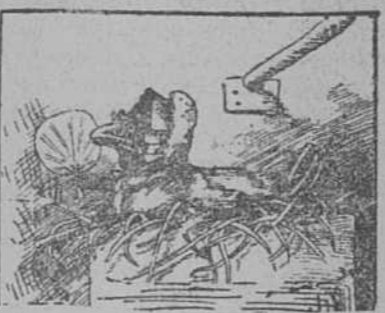
¡Uf, qué calor! Y sigo asustada.