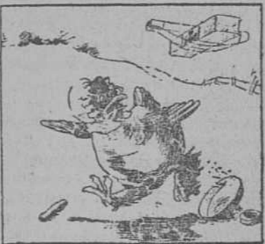
—¡Qué susto me ha dado eso!