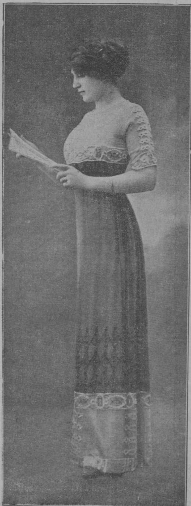
Traje de comida, modelo Laferriere.