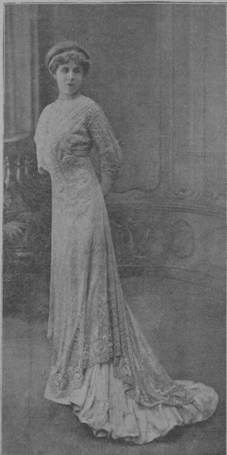
Traje de soirée, modelo Rondeau.