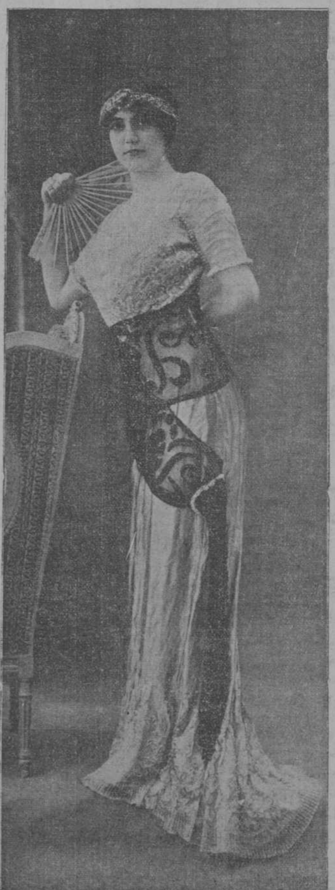
Traje de baile, modelo Laferriere.