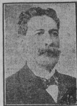
GENERAL FERNANDO FIGUEROA Presidente de la República de El Salvador República modelo

Si la prensa es el más alto exponente del grado de cultura, de progreso y del desenvolvimiento político-social de un país, si de un modo evidente se refleja en ella, los beneficios materiales que disfrutan sus habitantes y el medio ambiente moral que los rodea, hay que convenir entonces, juzgando por la lectura de los periódicos salvadoreños, que en esa República se debe de vivir en una felicidad paradisiaca.