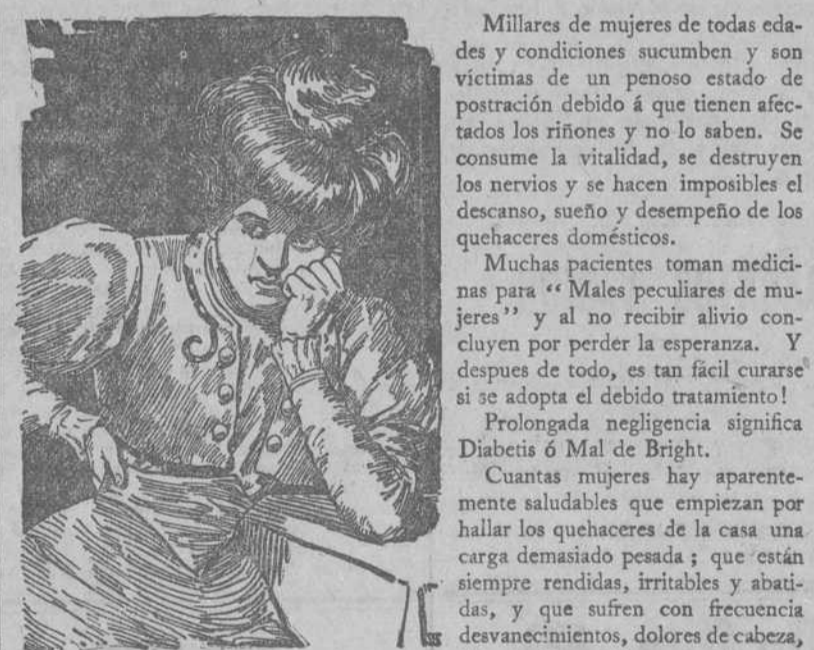
"Cada Cuadro Habla por Si."

Millares de mujeres de todas edades y condiciones sucumben y son víctimas de un penoso estado de postración debido á que tienen afectados los riñones y no lo saben. Se consume la vitalidad, se destruyen los nervios y se hacen imposibles el descanso, sueño y desempeño de los quehaceres domésticos.