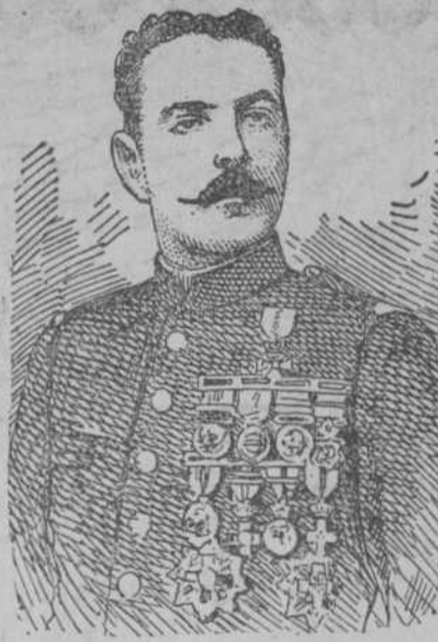
D. FEDERICO JULIO CEBALLOS Teniente coronel del regimiento de Melilla, muerto heroicamente en el sangriento combate librado con los rifeños el día 18 del actual. Es el primer jefe de nuestras tropas en campaña que murió en el cumplimiento de su deber.