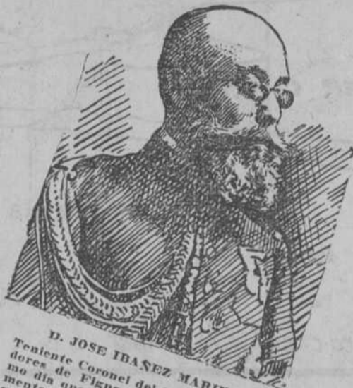
D. JOSE IBANEZ MARIN Teniente Coronel del Batallón Cazadores de Figueras, muerto el mismo día que desembarcó y en el momento de hacer alto con su batallón que se retiraba por escasez de la línea de combate.