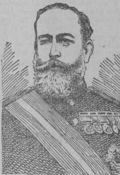
D. JOSE MARINA VEGA Teniente General y general en jefe del ejército expedicionario en Africa.