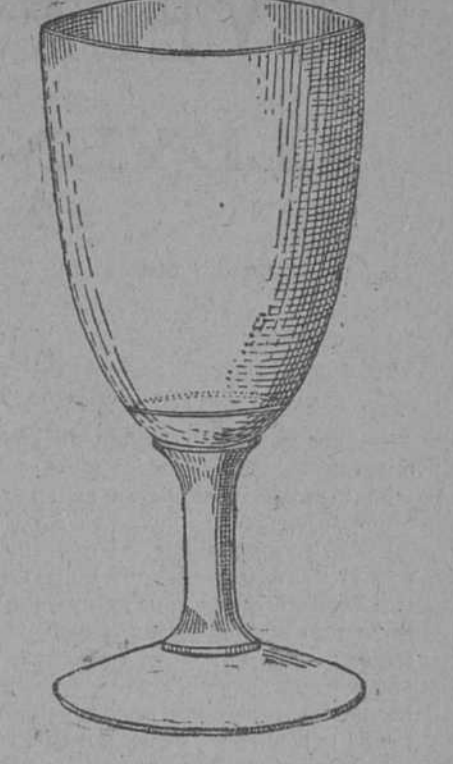
Copas para agua la docena... $ 2.00