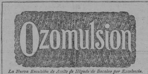
La Nueva Emulsión de Aceite de Hígado de Bacalao por Excelencia.

Está desapareciendo el color de su preciosa faz? Se encuentra delgado, débil y de mal humor? Cuando esto sucede el corazón de la madre está triste; ella anhela algo que devuelva el encanto de la salud á las tiernas mejillas del infante; quiere algo que le dé vigor á su cuerpecito.