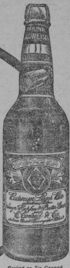
Corked or Tin Capped

GALBAU Y CIA., Distribuidores, Habana, Cuba,