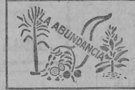
MARCA LA "ABUNDANCIA"

Las formas orgánicas del amoniaco animal y fosfato de cal, son los únicos abonos que pueden ser usados sin causar daño ulterior a la tierra y a la cosecha. Siempre resulta un aumento, despues de aplicar este abono juiciosamente, durante cuatro ó cinco cosechas, en pequeñas proporciones de 5 á 10 toneladas por caballería según la calidad de la tierra y el sistema que para la siembra de la caña se observe. Estos abonos no contienen ácido mineral alguno; son muy ricos en fosfato de cal animal. Cada caballería de tierra sembrada de caña en Cuba, puede producir 200 ó 400 sacos de azúcar más, en proporción anual, de lo que produce actualmente. Se preparan abonos especiales para toda clase de terrenos y siembras. Para obtener más detalles, dirigirse á Swift & Company, Oficios No. 8, Habana.