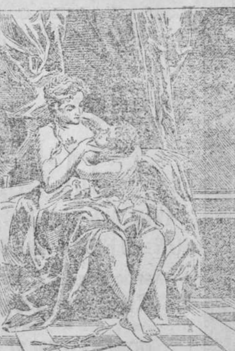
Así como Venus adora el Amor, la baratura del calzado de EL ENCANTO repercute por todos los ámbitos de la población.

Vende: para Señoras polonesas de cabritilla y buen charol abiertas