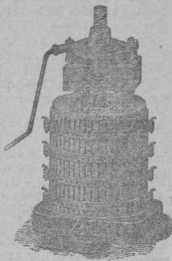
Presna para uva. Sin rival sistema americano. Pídanse el Catálogo.

TALLERES DE CONSTRUCCIONES MECANICAS APOLINAR ARRIETA PAMPLONA