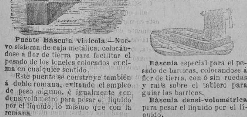
Puente Bascula vinicola. Nuevo sistema de caja metalica. colocándose a flor de tierra para facilitar el pesado de los toneles colocados encima en cualquier sentido.

L. PAUPIER CONSTRUCTOR RUE SAINT-MAUR, 84 PARIS 80 MEDALLAS DIPLOMAS DE HONOR