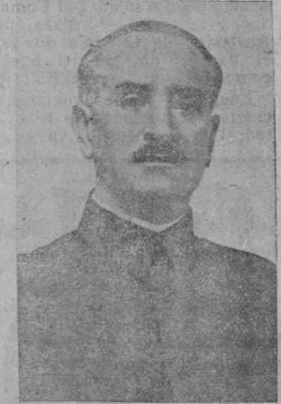
Almadén y toda la zona minera, ocupada en la tarde de ayer por

Y así en Guijos, Torrecilla, Pedrosejo, pueblos todos ellos conquistados hoy, rematándose la jornada con la conquista de