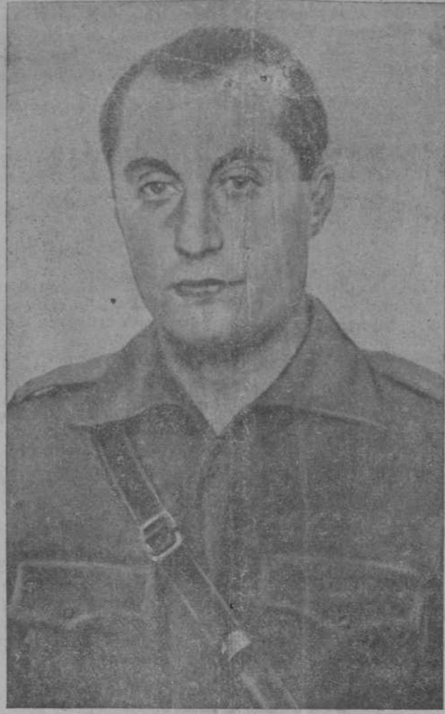
José Antonio, forjador maravilloso de la España Azul, Profeta del Imperio Español, presente siempre en nosotros, a quien debemos, los estudiantes, la idea de la Universidad Imperial y la Fé en los destinos de España

En lugar de la caduca y absurda Universidad de ayer, se alza, cobrando entera realidad, la Universidad Imperial, que incorpora a las viejas esencias tradicionales el ansia juvenil de las generaciones nuevas, para formar un todo orgánico y homogéneo, en el cual, y bajo la suprema advocación del nombre de Dios, trabaje todo español capacitado.