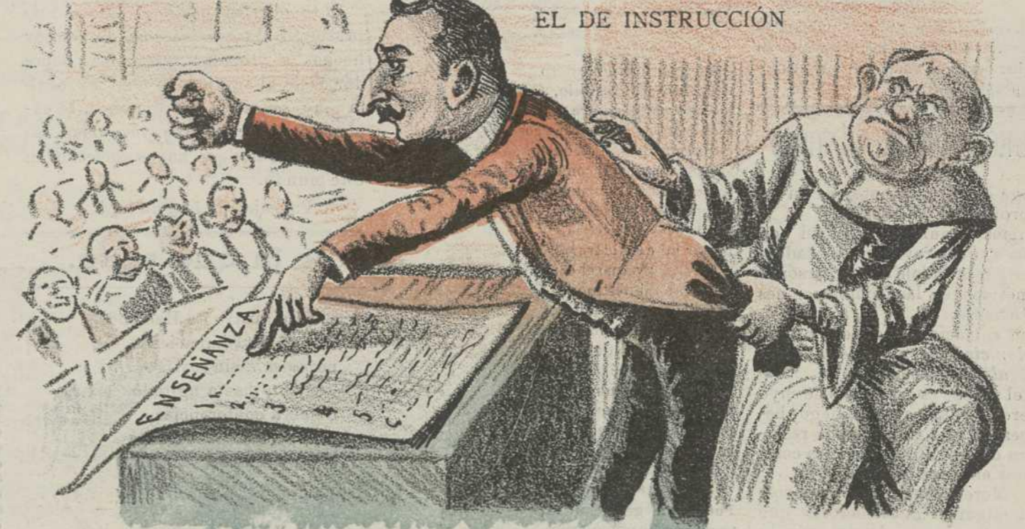
Muchas reformas, y muchas energías... si no le tiran de la levita.