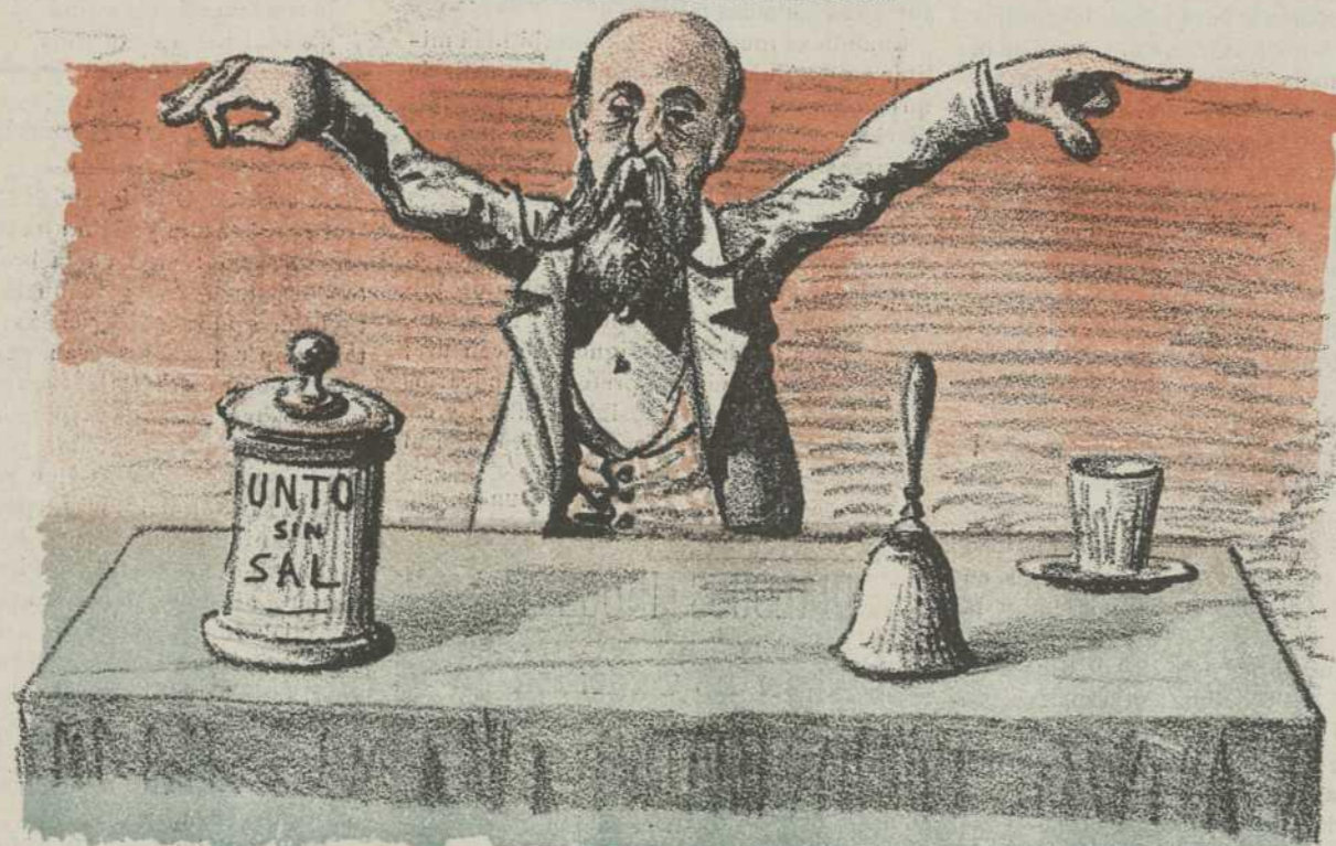
Retórica, poética... música celestial y ... baselina perfumada.