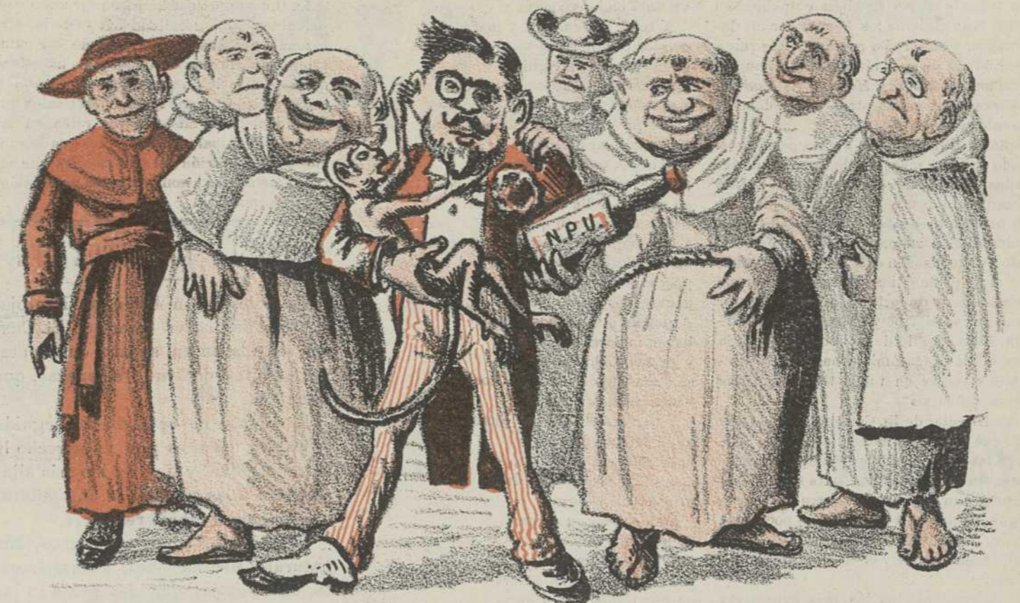
Una mona del Muni, el N. P. U. . los RR. PP. de PP y W.