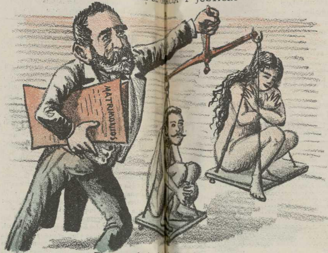
El sumun de la gracia de la gracia.)