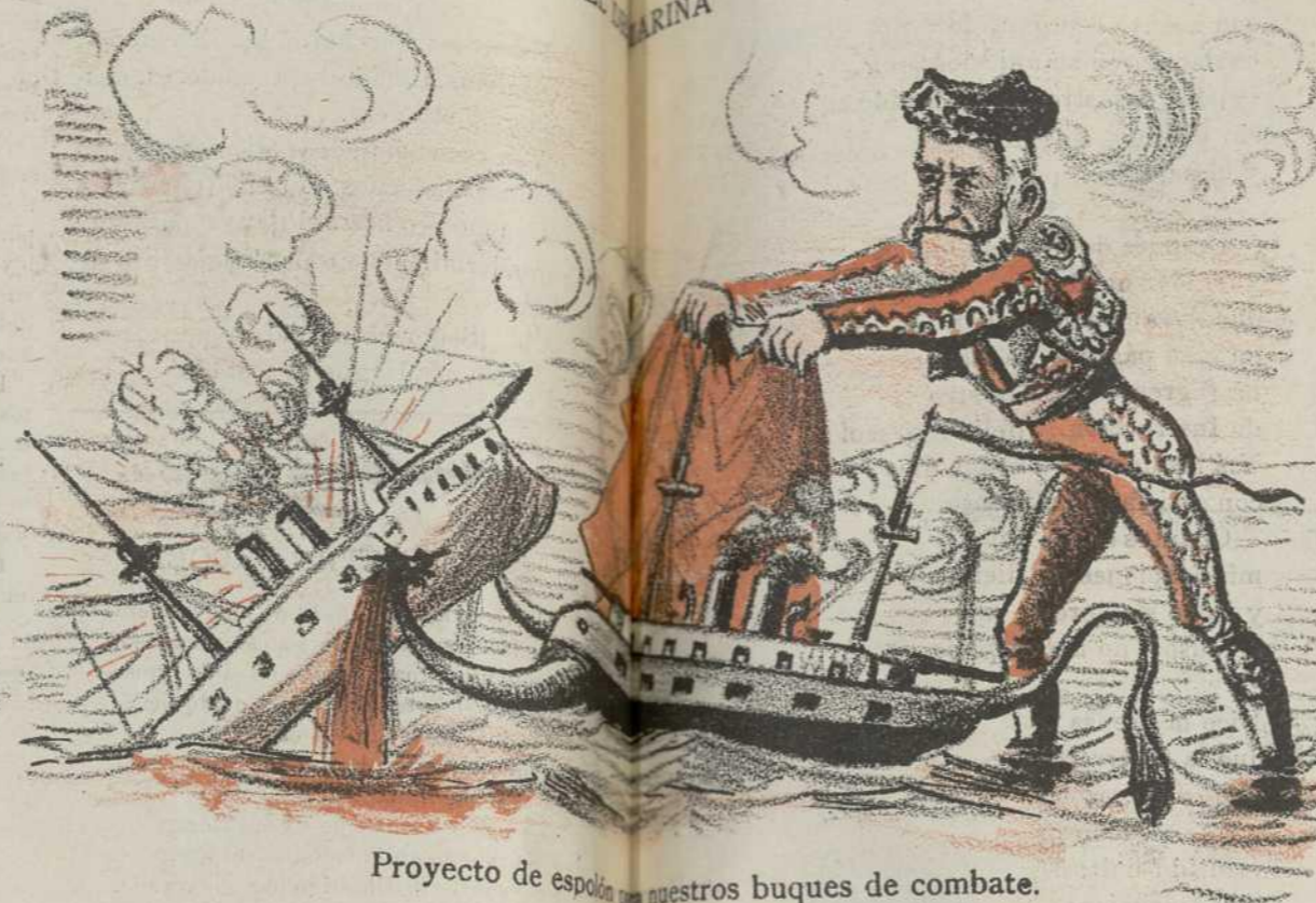
Proyecto de espaldas para nuestros buques de combate. (De su invención.)