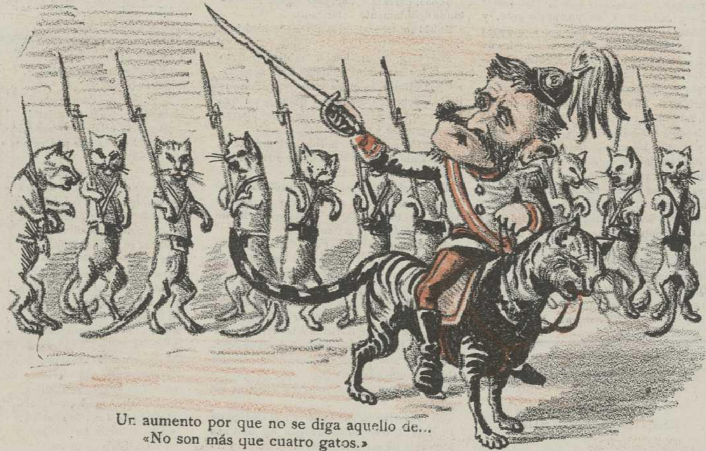
Un aumento por que no se diga aquello de... «No son más que cuatro gatos.»