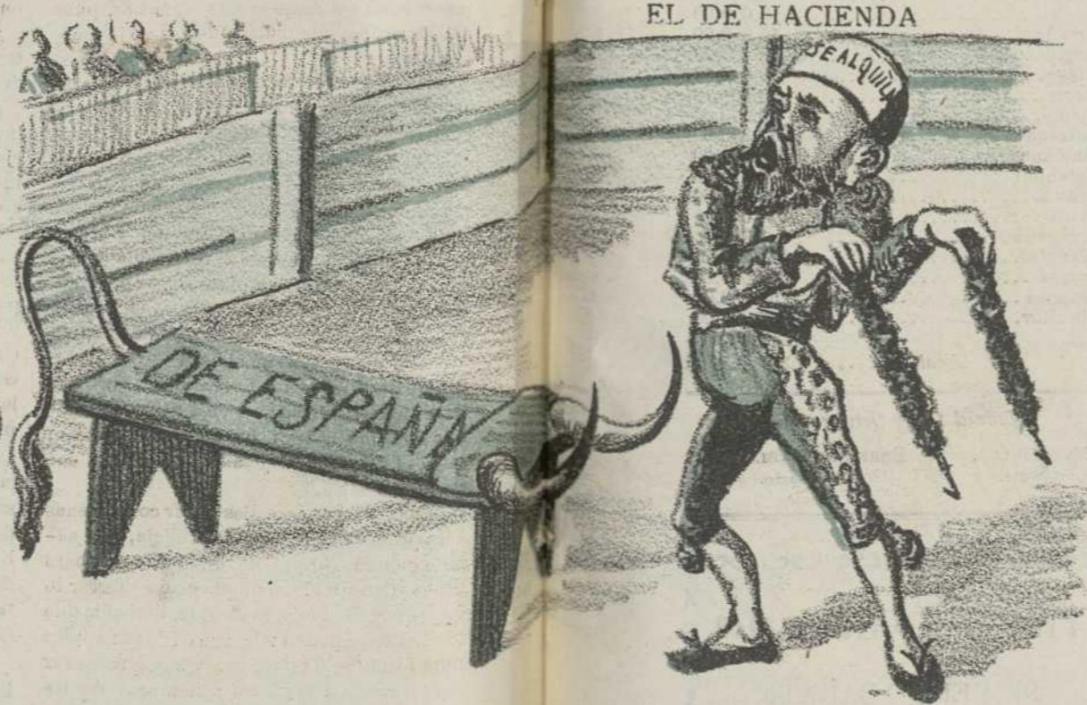
Estudio sobre cambios y cambiazos al Banco.