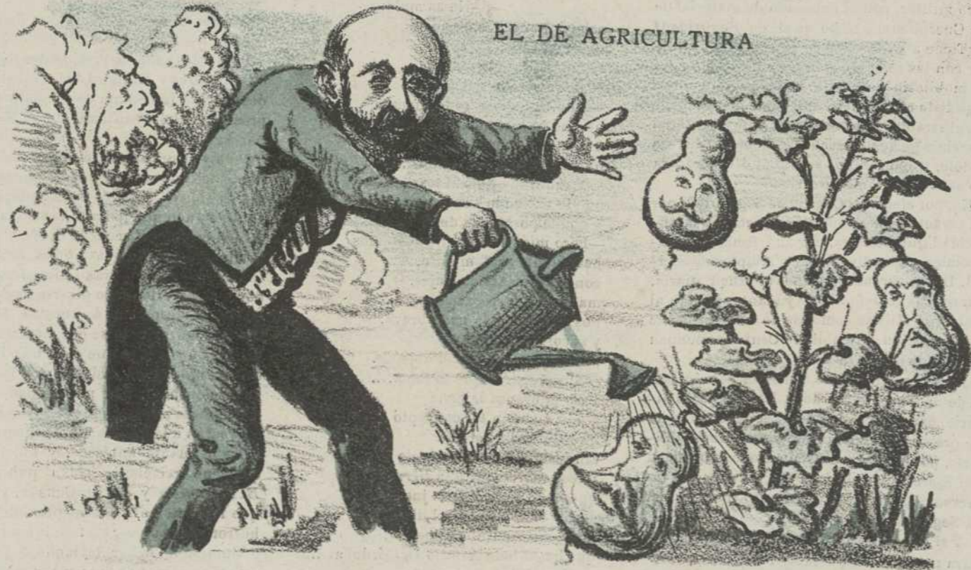
Ingerito de su invención para obtener Ministros de talento.