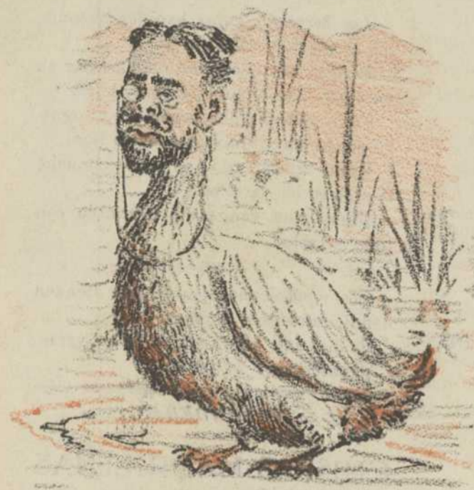
Un Ganso doble