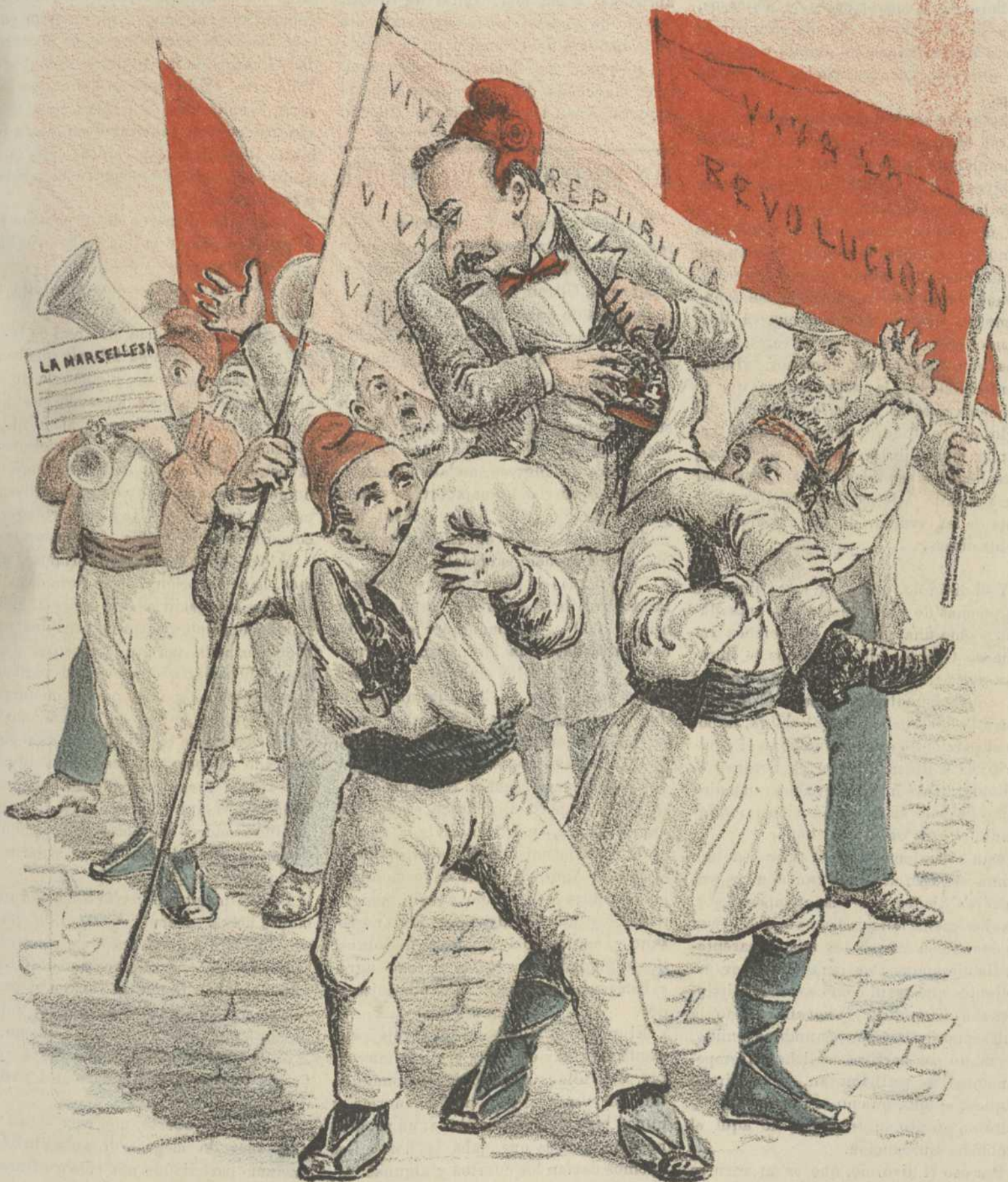
Un Ministro de la Corona