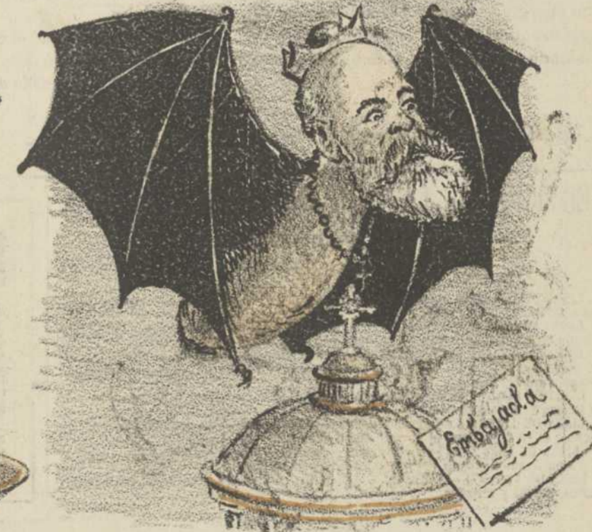
Gloria in exelcis Deo (Murcielago de cuidado)