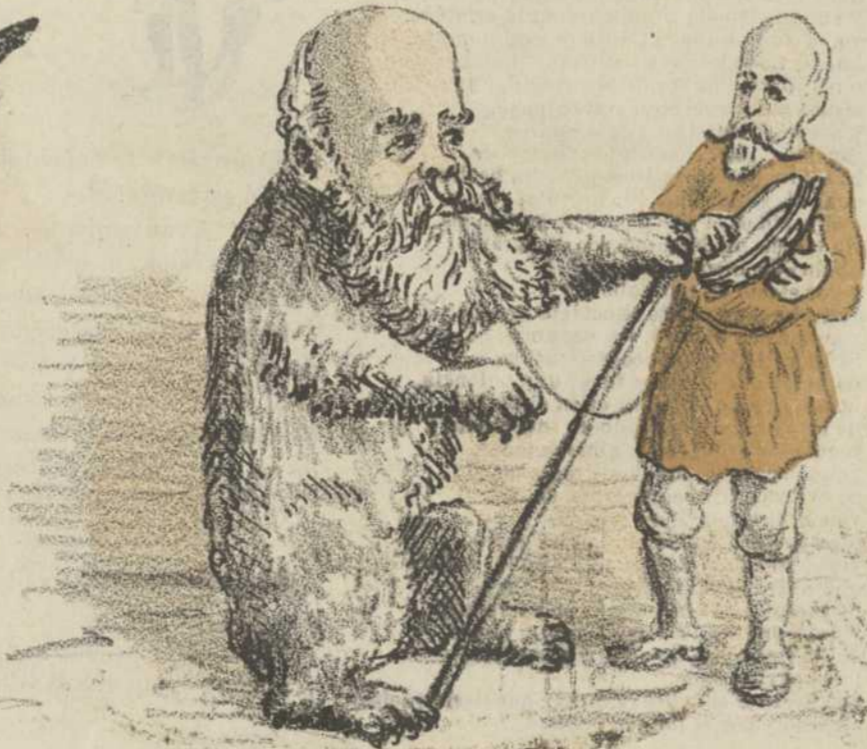
Oso de la Tierra