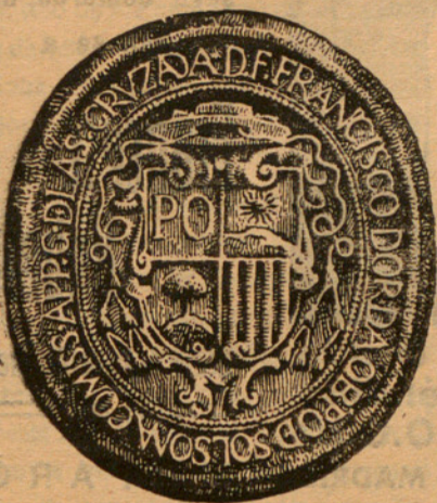
Segell de l'Abat Dorda

aval en el deure d'insistir recordant la importància de la seva personalitat.