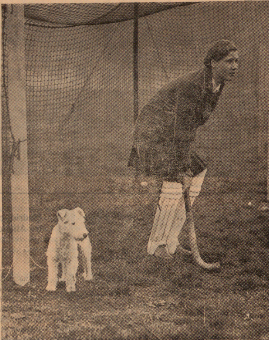
«Un gos «mascota» Velasco a Burgos

Les jugadores del «Alexandra Ladies Hockey Club», tenen gran fe en la influència del seu gos mascota «Oedipus» en la defensa de la seva porta.