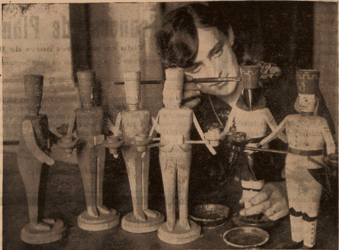
Els districtes alemanys de Turingia i Saxònia, on les joguines de talla constitueixen una especialització, han entrat ja en plena febre de treball en apropar-se les festes de Nadal. Soldats, petites cases, animals, vaixells i tota mena de joguines, surten ràpidament acabades de les hàbils mans d'aquestes joves treballadores, veritables artistes de la joguina. Heu's acl l'operació de la pintura d'una talla.