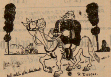
A LES MANIOBRES MILITARS L'opinió del cavall: —Visca la motorització, mon corone! (De Marianne, de París)

En la sessió d'ahir jennmig d'una gran expectació, el senyor Lerroix pronuncià un extens discurs, en el curs del qual explicà el programa del nou Govern.