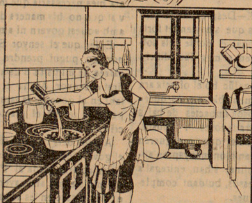
Amb la solució preparada mullo 15 quilos de carbó que abans hauré posat en un cubell, fins que quedi ben mullat. ¡Questió d'un minut!