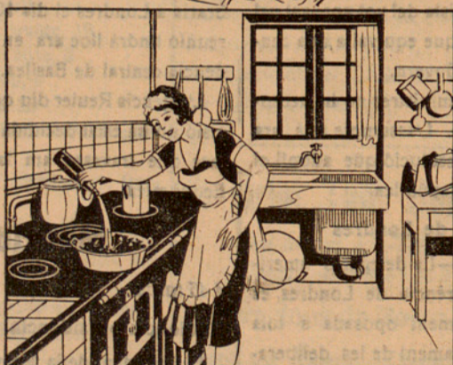
Amb la solució preparada mullo 15 quilos de carbó que abans hauré posat en un cubell, fins que quedí ben mullat. ¡Qüestió d'un minut!