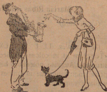
—No cal que pareu de tocar. Ja us ho tiro a la bacina. De Everybody's Weekly, Londres.

Ens plau molt la fidelíssima actuació del Banc de Catalunya.