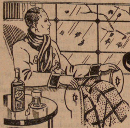
De venda en totes les bones Farmàcies, a Ptes. 5'00 el flasc