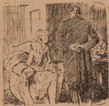
A l'Institut de Bellesa

El diumenge passat al matí varen celebrar-se en el conegut camp de l'«Estadi», que és en el Camí de la Gegata, els campionats atlètics de Mataró que ha organitzat la infadigable Agrupació Excursionista Laietània, mereixedora de millor sort, perquè gairebé ens fa vergonya que el públic, la grandiosa quantitat de públic esportiu—molts d'ells es creuen que ho són d'esportius—que hi podria haver i que no més té la seva reconeguda simpatia pel futbol, no hi va assistir, fallant els declarats càlculs que equivocadament elglub suposa que la nostra ciutat és notablement esportiva i que acudeix en gran nombre a tots els actes esportius que se celebren.