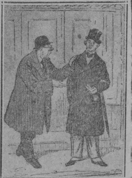
—¡Caramba, Carlos! En cuanto te echas un nuevo amigo, ya no lo dejas del brazo. —¿Por quién lo dices? —Por... mi paraguas.

El nuevo empleado.—¿Qué hay esta botella? El farmacéutico.—Es lo que me trae cuando no nos es posible frisar las recetas.