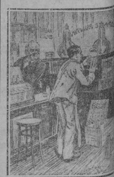
El nuevo empleado.—¿Qué hay esta botella? El farmacéutico.—Es lo que me trae cuando no nos es posible frisar las recetas.