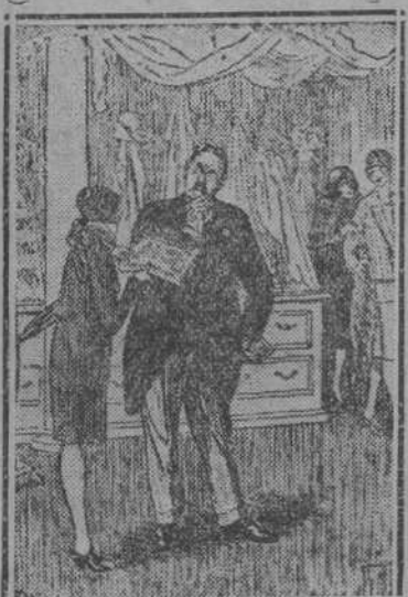
—En esta diario anuncian ustedes dos mil vestidos de verano. ¿Podré verlos?