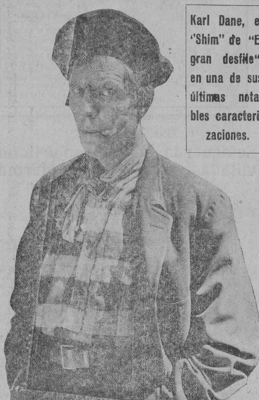
Karl Dane, el "Shim" de "El gran desfile", en una de sus últimas notables caracterizaciones.

En EL PUEBLO CANTABRO encontrará usted siempre combinaciones muy convenientes para el éxito de sus anuncios y la compensación positiva del dinero que invierte.