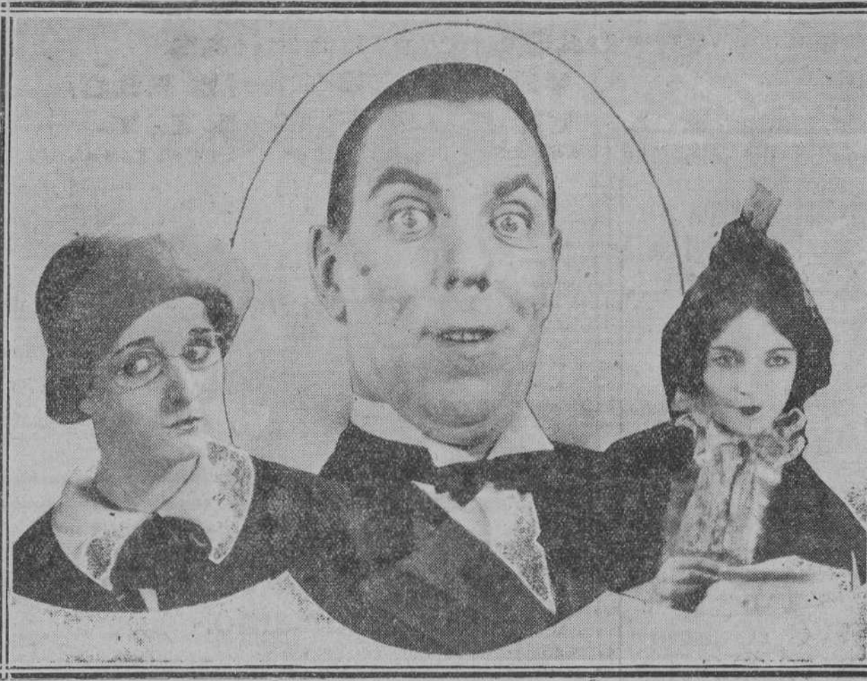
He aquí, lector aficionado, a Gertrude Olmstead, Lillian Gish y John Gilbert, tres relevantes figuras del arte mudo.