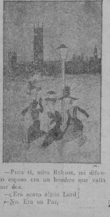
—Pues sí, mié Robson, mi difunto esposo era un hombre que valía por dos. —Era acaso algún Lord? —No. Era un Par.