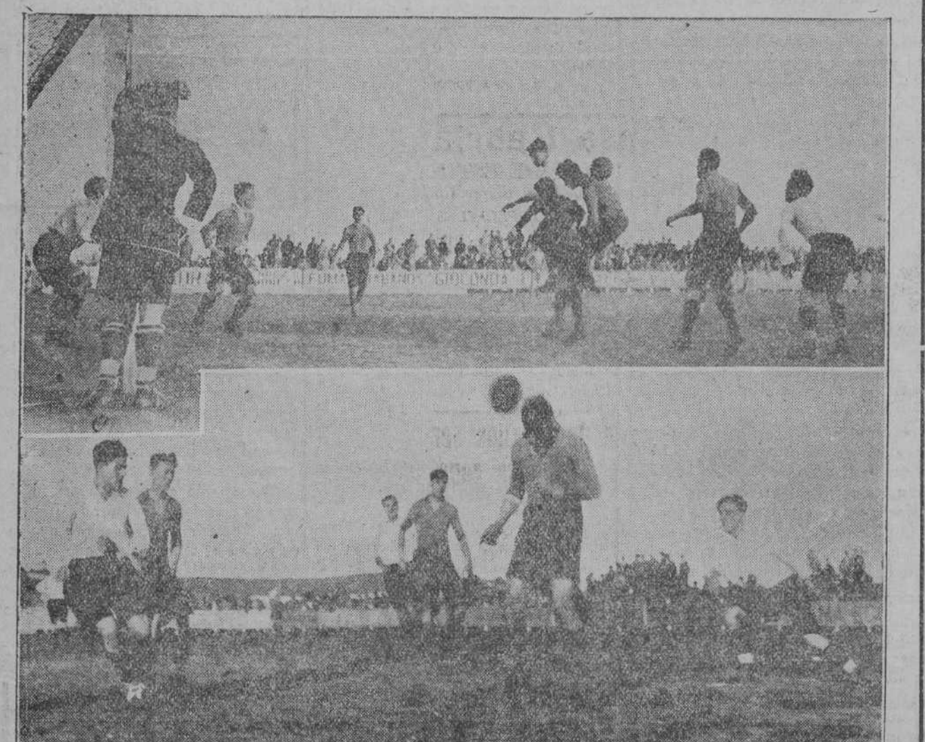
DEL PARTIDO RACING-ECLIPSE.—Dos momentos del soporífero encuentro jugado el domingo en los Campos de Sport.

Los santanderinos Liaño, Domingo, San José, Antón y Sarmiento