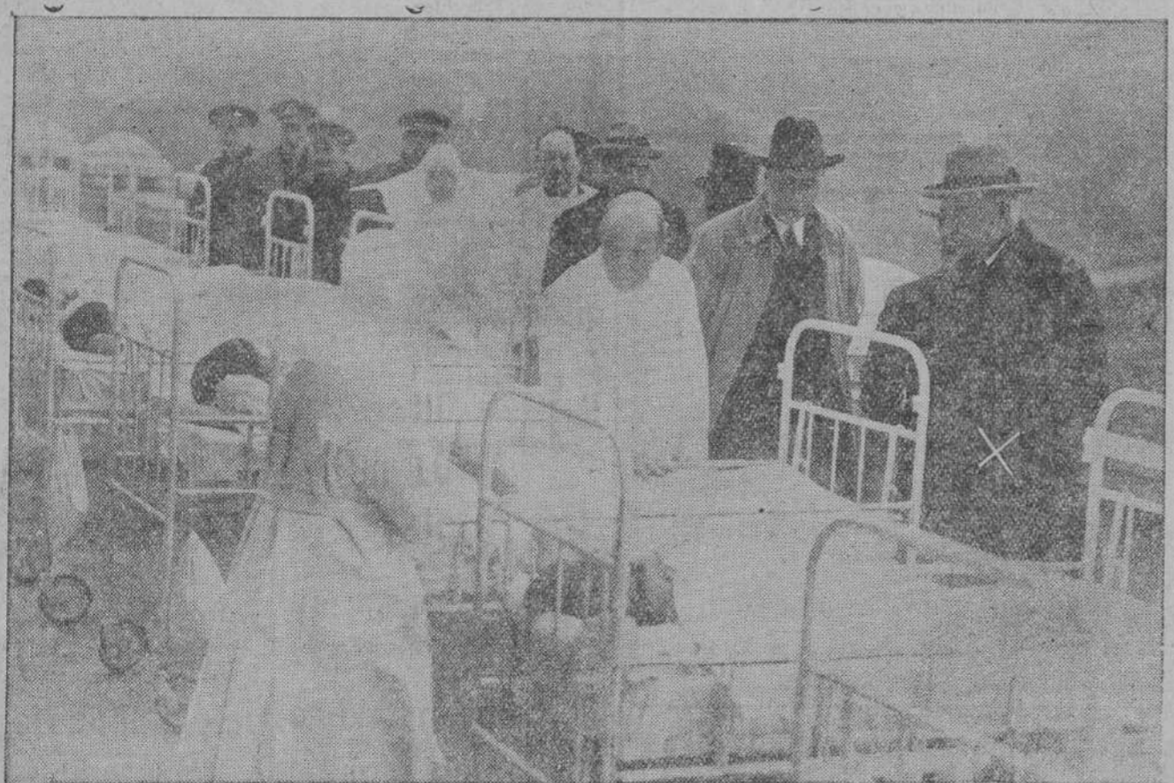
El general Primo de Rivera y el ministro de la Gobernación en su visita al Sanatorio de Pedrosa.

La próxima reunión se celebrará en Sevilla el día 31 de enero próximo y será presidida por el ministro de Hacienda, el cual aprovechará el viaje para dar su anunciada conferencia sobre el reciente decreto de organización corporativa nacional.