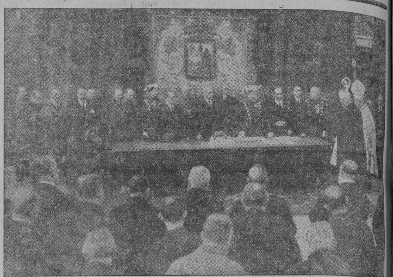
El general Primo de Rivera y el ministro de la Gobernación, con las autoridades y representaciones, en el acto de colocación de la primera piedra para el cuartel de la Guardia civil.

Ya lo pondrá en claro la autoridad correspondiente.