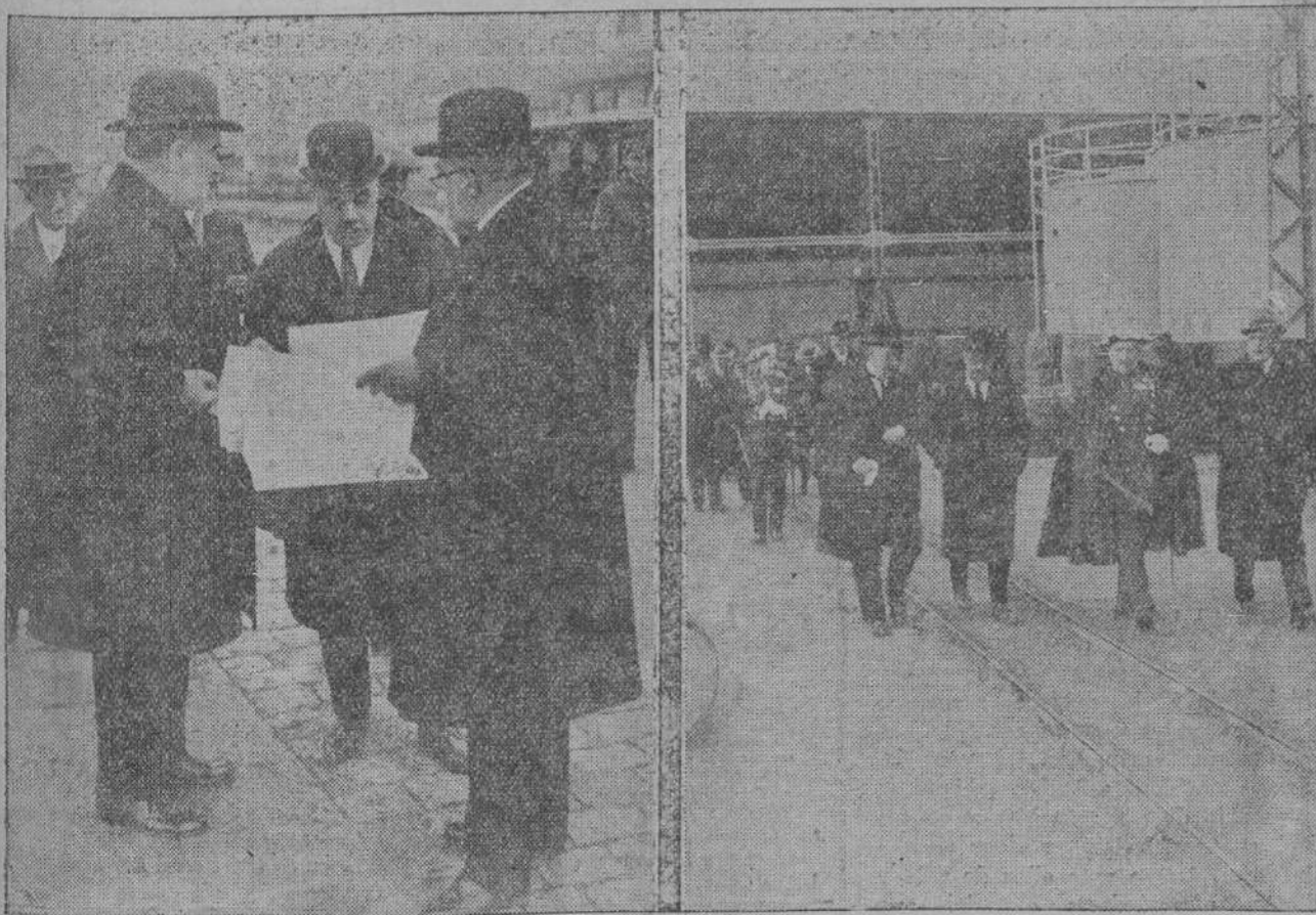
El ministro de Fomento, con los señores ingeniero y presidente de la Junta de Obras, viendo los planos de mejoras del puerto.—El conde de Guadalhorce visitando las dependencias del Depósito Franco.

Organizada la comitiva, en la que formaron más de setenta automóvi-