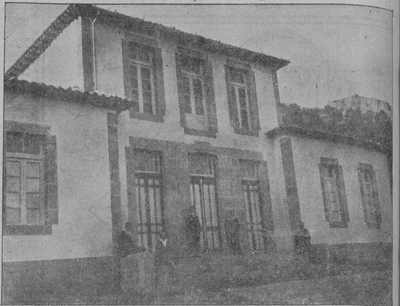
Escuelas de Miera, construidas merced a la generosidad del ilustre marqués de Valdecilla y que, inauguradas recientemente, han librado a doscientos niños de pasar su vida escolar en unos locales faltos de luz, de aire y de todo requisito pedagógico.

La subida desde Puente Nuevo a Miera es lo más atrevido y fantástico que hemos visto en carreteras: Una montaña rocosa y desarmada, con declive cortado a tajo y abajo, en su base, el río que con dificultades se abre paso por entre enormes trozas de piedra desprendidas de la montaña.