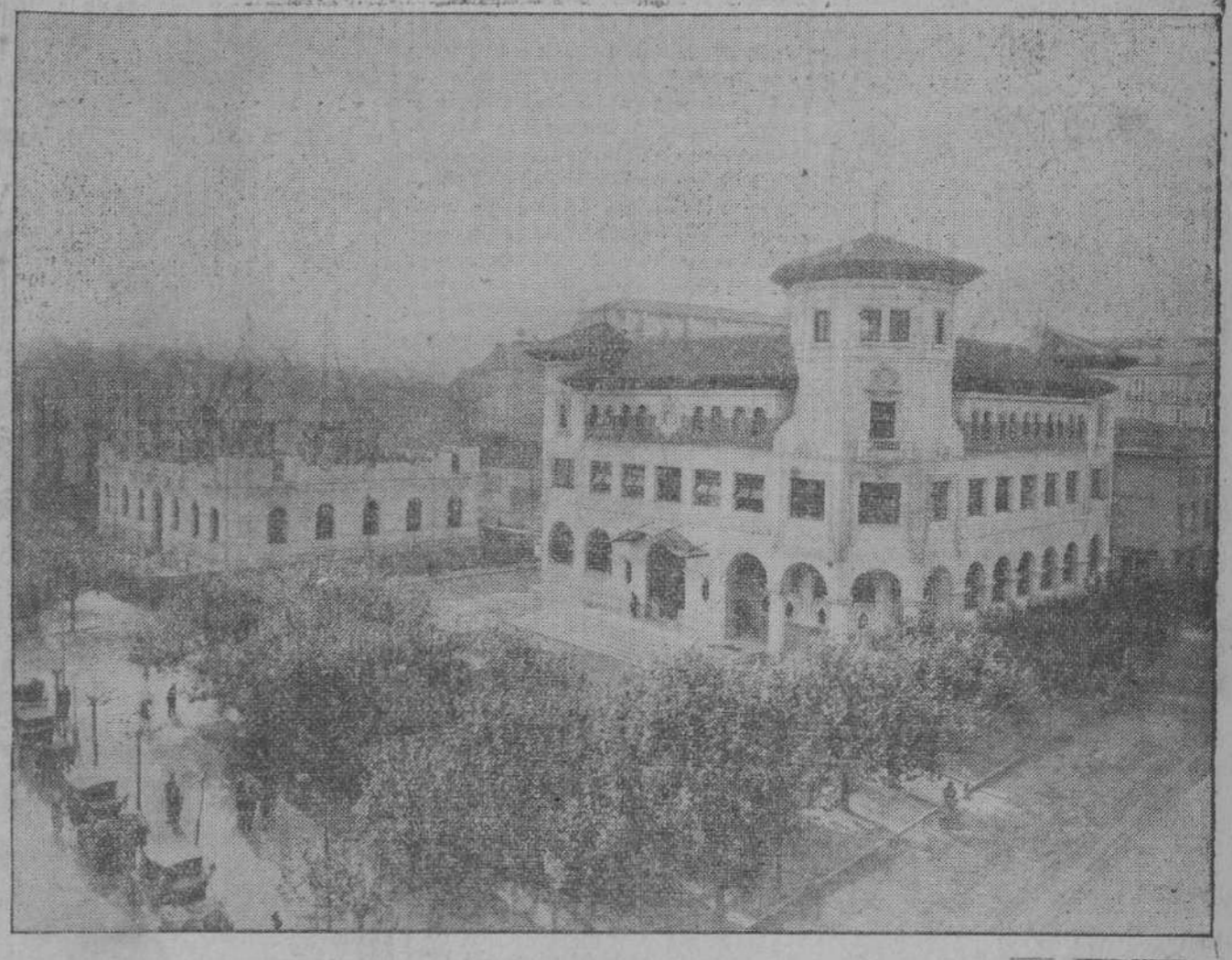
El nuevo magnífico edificio de Correos y Telégrafos, inaugurado ayer, y que será abierto al público mañana lunes. (Al fondo, las obras del nuevo edificio para el Banco de España, que pronto será también una realidad en la edificación santanderina.

Se proyecta celebrar el acto en el teatro Eslava.