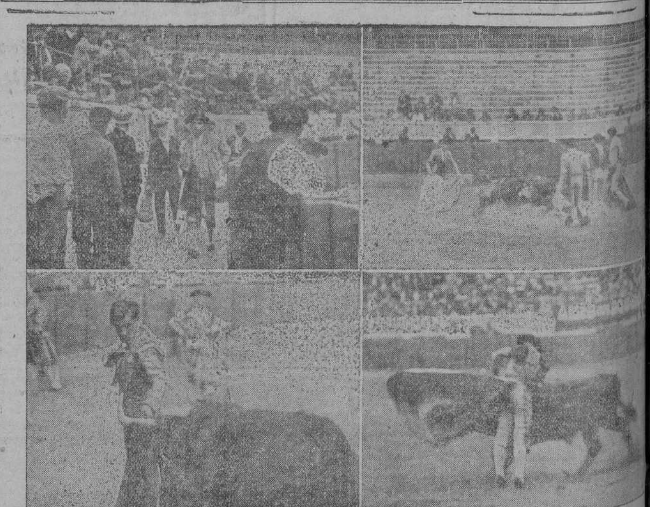
DE LA BECERRADA DEL DOMINGO.—La mayor novedad fué el paso hecho por los espadas dentro del callejón por llegar tarde a la plaza.—Aspecto imponente (para el empresario) de los tendidos durante la lidia del primer bicho.—Domínguez perfilado a dos dedos de los pitones en su primer becerro y «Chavito» apuntándose una media verónica como los buenos.

Bautizo de una mura. JEREZ, 27.—En la iglesia de San Marcos ha sido bautizada una mura de diez y ocho años, asistiendo al acto las autoridades civiles, militares y eclesiásticas.