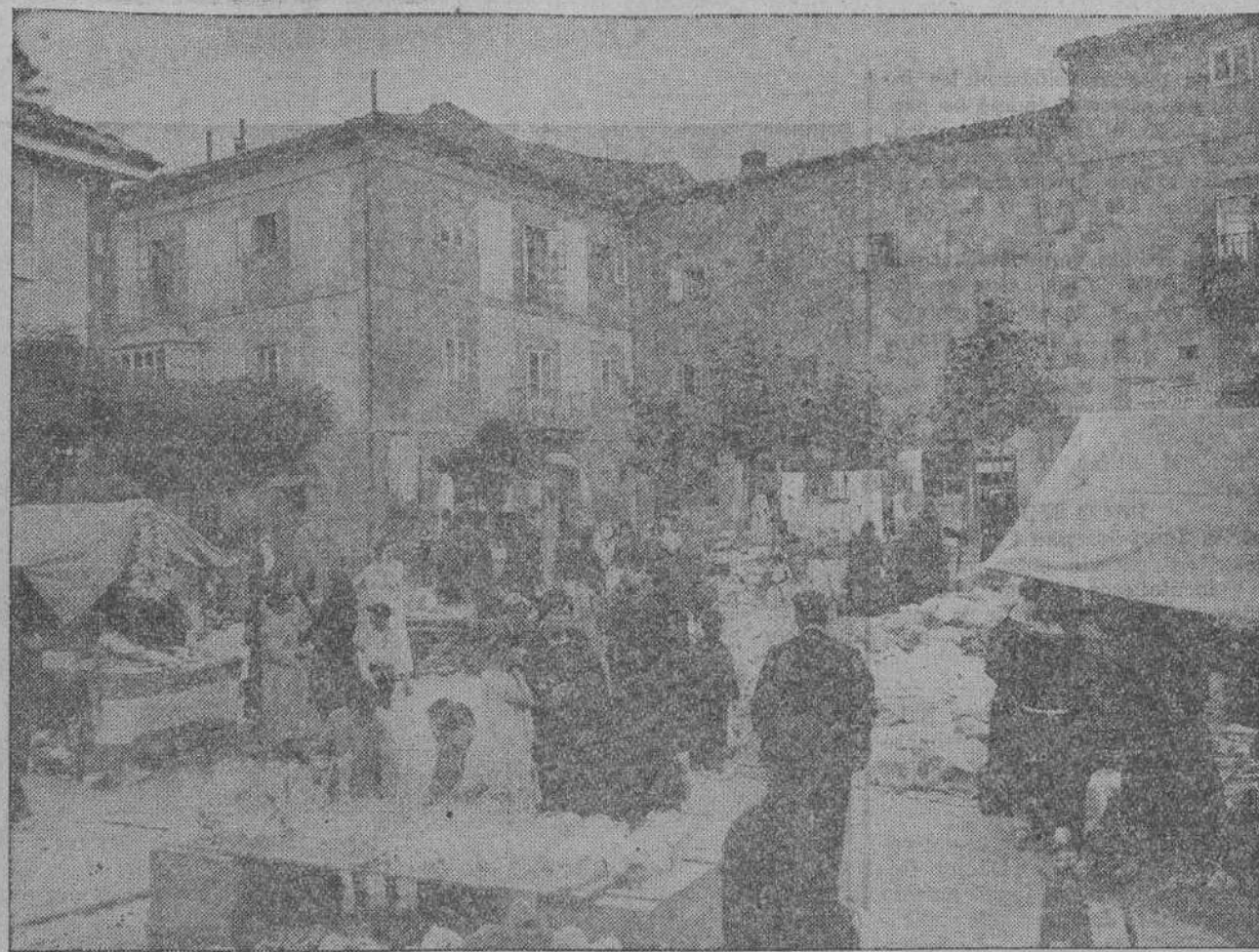
Durante las fiestas de San Mateo, la Plaza Mayor se convierte en un magnífico mercado al aire libre, donde las mujeres que llegan de fuera se surten de todo cuanto necesitan en el invierno.