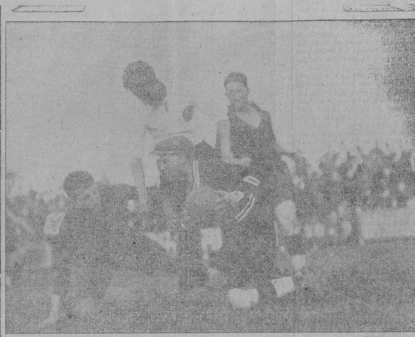
Un momento del encuentro Gimnástico de Valencia-Racing, jugado el domingo en los Campos de Sport.

Díaz, que pasa muy rezagado, por sufrir nuevo pinchazo, se nos ha mostrado en la Vuelta a Cantabria como una legítima esperanza del equi-