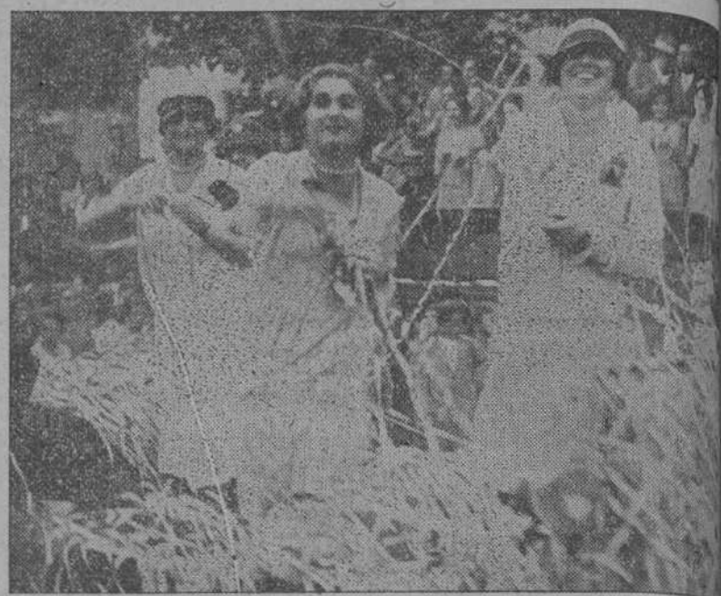
DE LA BATALLA DE FLORES DE LAREDO.—Bellísimas santanderinas durante el animado festival.

La noche última la pasó muy intranquilo. Su estado inspira temores, porque, al parecer, la enfermedad de ahora es una recaída de la que le aquejó en la capital andaluza. La familia ha llamado al doctor Jiménez, de Sevilla, que actualmente se halla en San Sebastián.