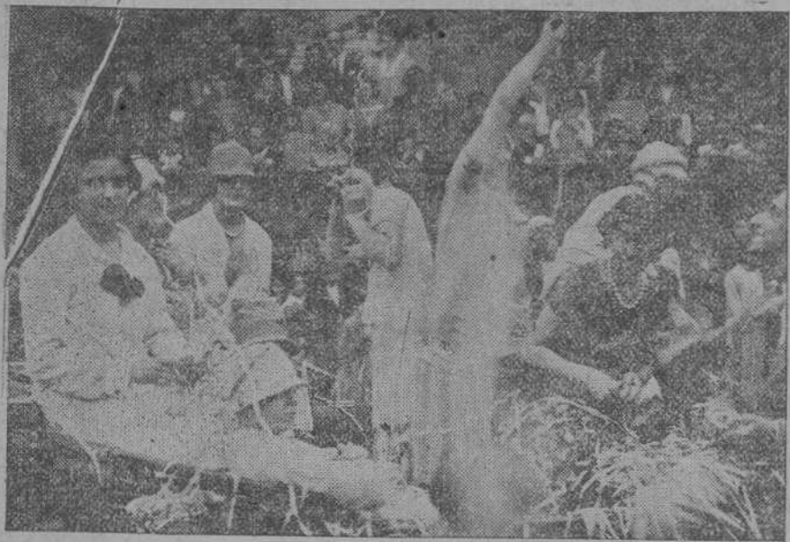
DE LA BATALLA DE FLORES DE LAREDO.—Un coche ocupado por lindas «combatientes».