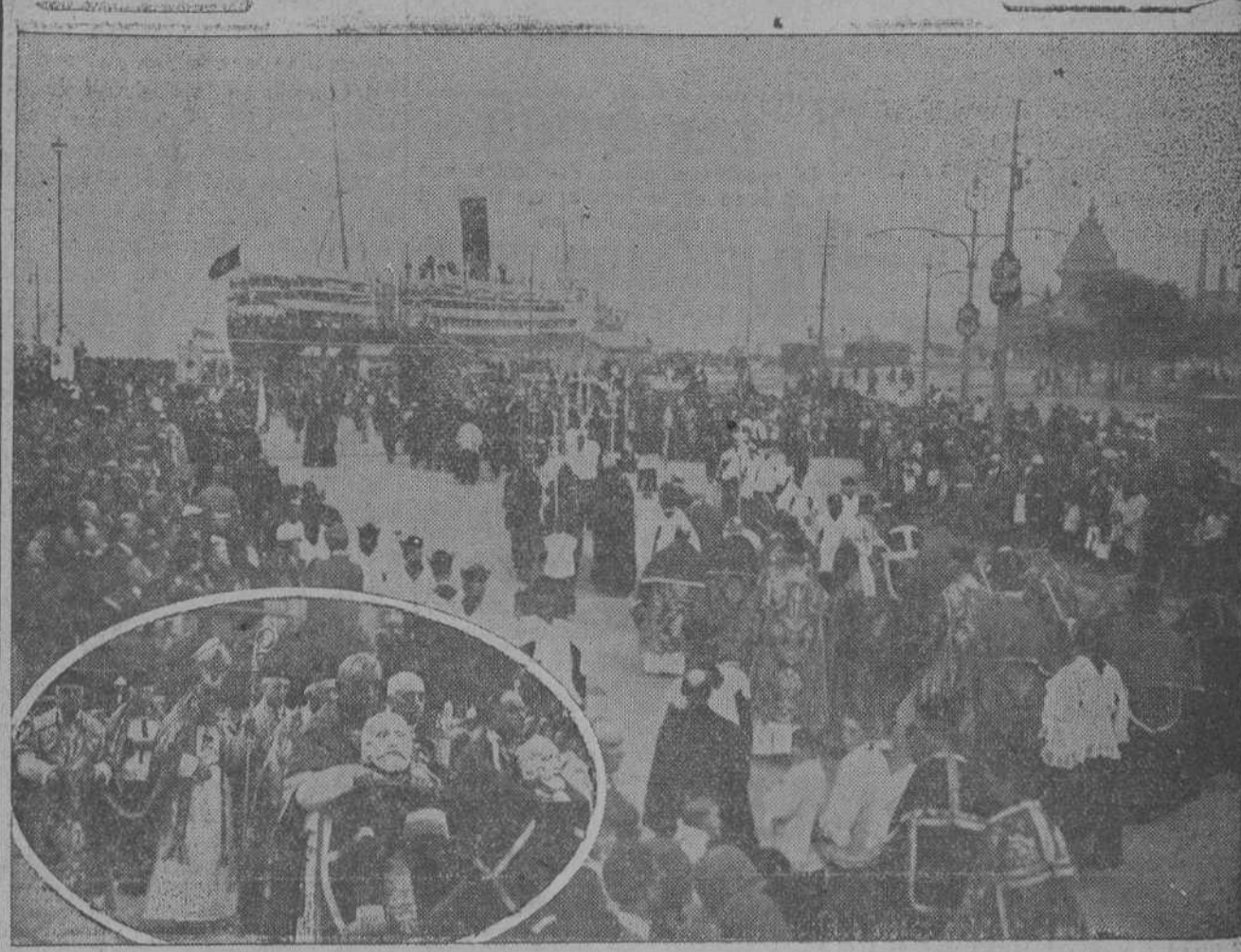
DE LA FIESTA DE LOS SANTOS MARTIRES.—Varias interesantes notas gráficas de la procesión.