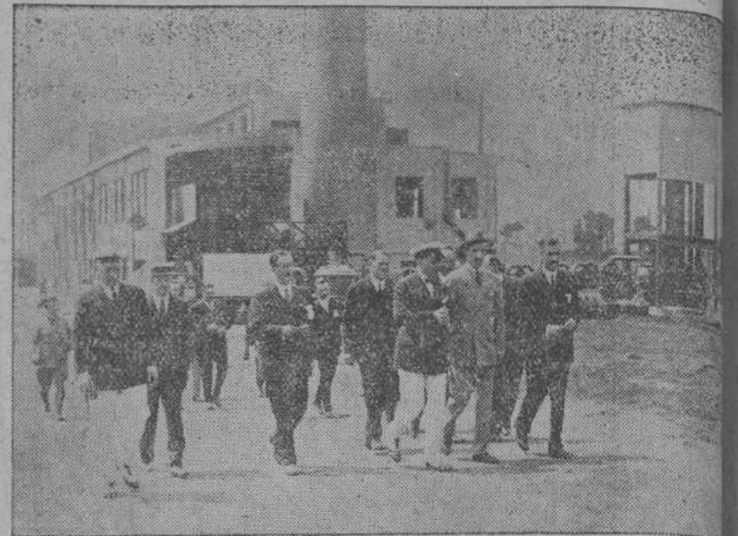
EN LA «INDUSTRIAL RESINERA RUTH», S. A.—El Monarca después de su larga visita a la magnífica industria santanderina.

canfor que la «Ruth» tiene que vender forzosamente al extranjero por no tener en España compradores, ya que las fábricas de películas, primeras consumidoras del alcanfor residen en el exterior. Siguieron el Monarca y el príncipe de Asturias, después de examinar con detenimiento toda esta maravillosa instalación, recorriendo la fábrica en la que visitaron los pabellones de Barnices y Esnaletes, Barnices al alcohol, Centrales térmica y eléctrica, Talleres, Garaje, Almacenes, Depósito de Líquidos, Laboratorio Químico de Alcanfor, Laboratorio de Pinturas, Expediciones, Taller de envases, Oficinas y demás dependencias, empleando en ello cerca de dos horas, lo que da clarísima idea del interés que en don Alfonso despertó la visita de la «Ruth». Después, el Rey, el príncipe de Asturias y sus acompañantes, fueron obsequiados en uno de los pa-