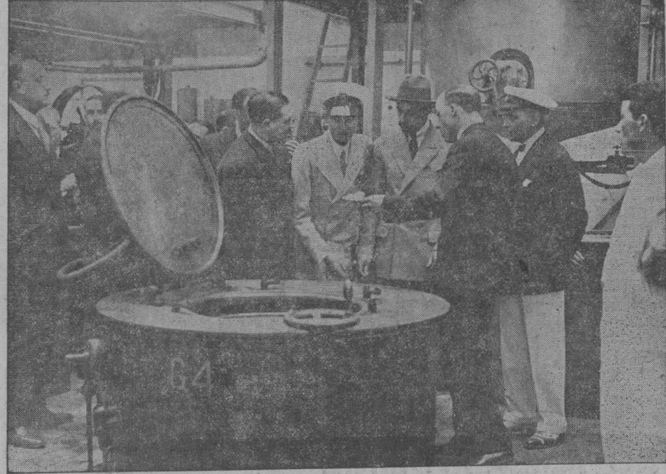
EN LA «INDUSTRIAL RESINERA RUTH» S. A.—Su Majestad el Rey y el Príncipe de Asturias examinando el alcanfor artificial.

narca fué saludando a todos, y después se dejó guiar por el presidente del Consejo de la Resinera Ruth y director gerente hasta los pabellones donde se fabrican las excelentes pinturas de la marca «Ruth», viendo con detenimiento toda la sección de copales y las demás que encierra esta fabricación ventajosamente conocida en toda España. Siempre acompañados de las personas antedichas, que alternaban en sus explicaciones a los augustos visitantes, recorrieron Su Majestad el Rey y el príncipe de Asturias todo el edificio destinado a la fabricación de alcanfor artificial y que está constituido por una única nave sin columnas llena de modernísima maquinaria donde se obtienen tan maravillosos resultados. Con todo detalle le fué explicada al Monarca la utilidad racional de esta industria del alcanfor sintético desde sus tres aspectos económico, militar y técnico; el primero porque todas las materias necesarias para dicha fabricación se producen en España, siendo la principal de ellas la trementina que hoy se exporta en gran parte al mercado exterior y que transformada en alcanfor puede, como se hace, seguir exportándose, a un precio siete veces mayor. Desde el punto de vista militar el alcanfor sintético, por su absoluta idoneidad, está en condiciones únicas para la fabricación de la pólvora sin humo y respecto al carácter téc-