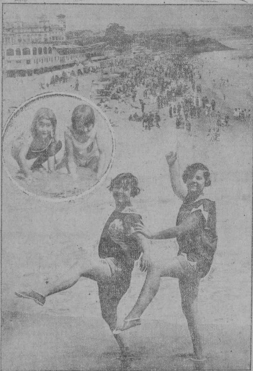
Un aspecto de la playa a la hora del baño. Dos bellas bañistas apocan ante nuestro redactor. En el círculo los niños jugando después de bañarse. (Foto y composición Samot.)