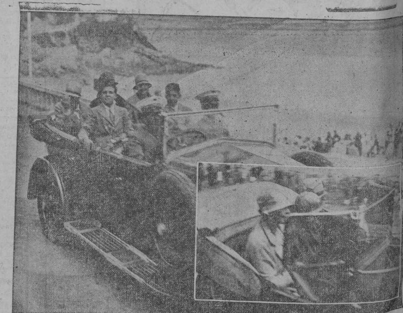
DEL VERANEO REGIO.—Su Majestad la Reina y sus augustos hijos saliendo de la playa después del baño de los infantitos.