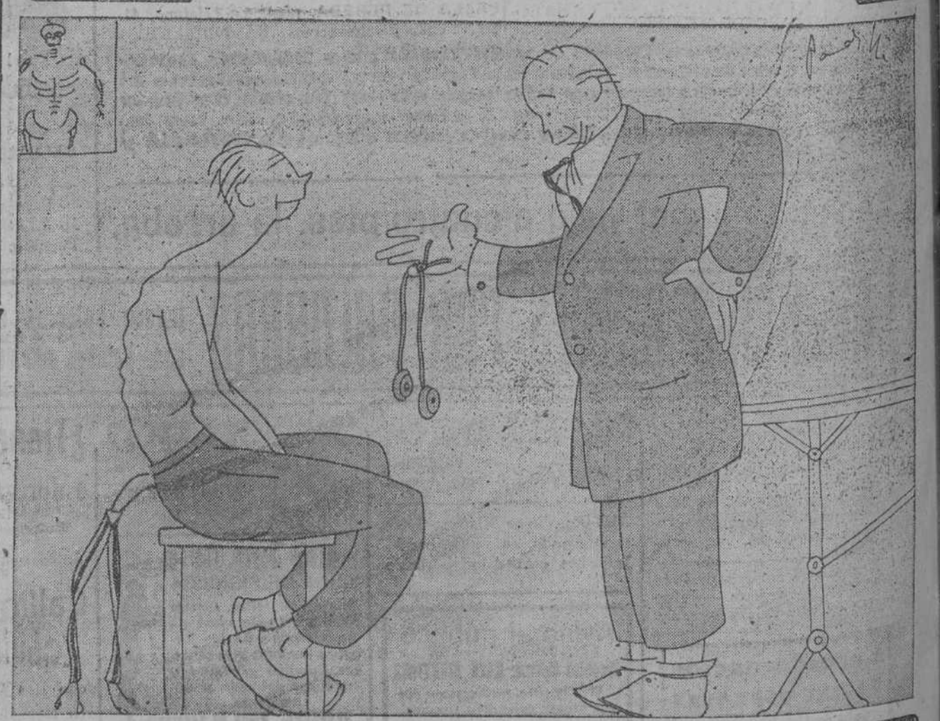
—Se le advierte a usted un pequeño murmullo... ¿Su padre de usted fué tuberculoso? —No, señor, relojero.