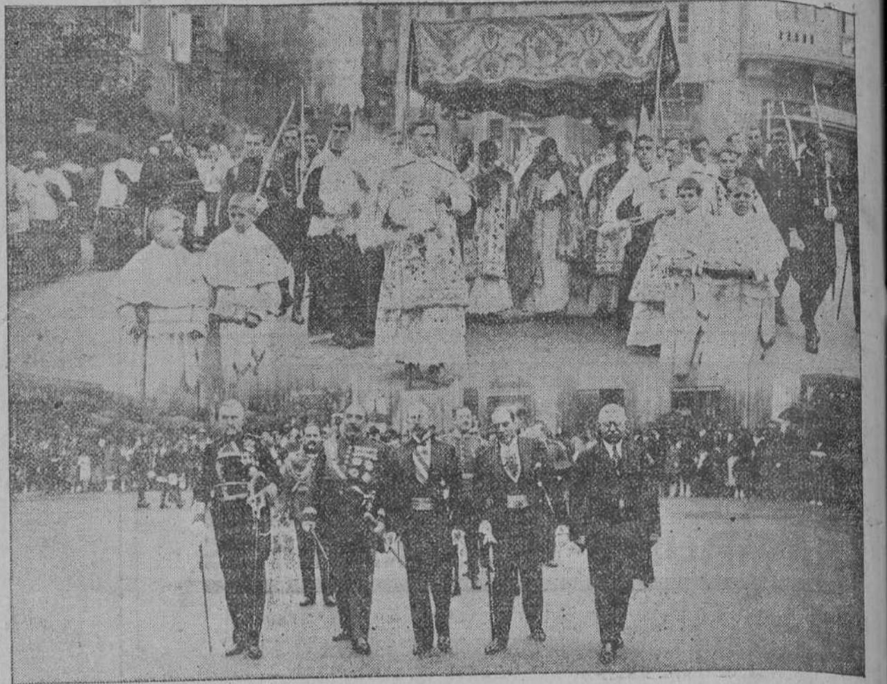
La procesión del Corpus, celebrada el domingo, al llegar a la plaza de Pi y Margall.—Las autoridades que presidieron el acto.