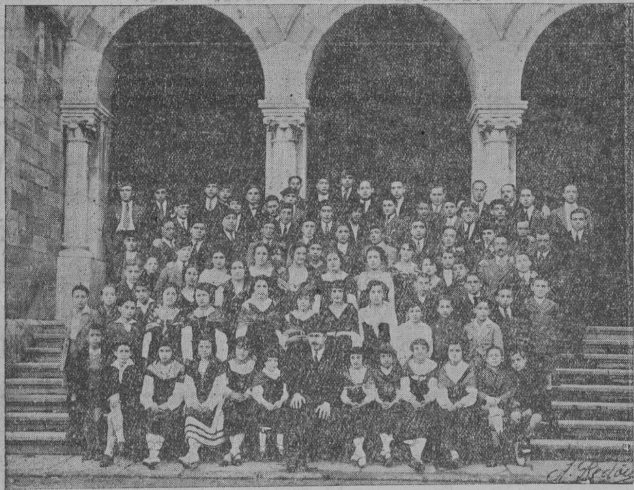
La Coral de Torrelavega, que en el concierto que dió el domingo en Ontaneda obtuvo clamoroso éxito.

Seis meses hace que unos cuantos hombres de buena voluntad, muy aficionados a las cosas musicales, pensaron formar en esta ciudad una Coral que pudiera ostentar el nombre con orgullo. Para comenzar a agrupar voces hubo que hacer no poca propaganda, pues aunque en pequeños grupos surgían jóvenes que cantaban y demostraban gusto y afinidad, nunca había prosperado la formación de una Coral disciplinada que poco a poco se fue convirtiendo en consoladora realidad.