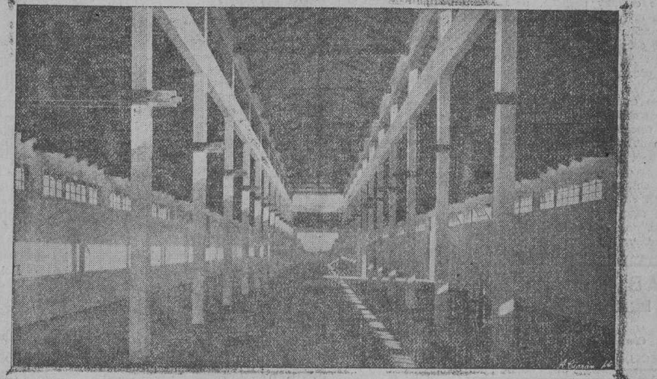
Interior del nuevo y espléndido pabellón, donde están instalados los ganados montañeses.